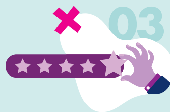
提供对商品和服务的反馈意见，或要求跟进